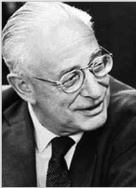
Michael Balint: Psihanalist englez de origine maghiară